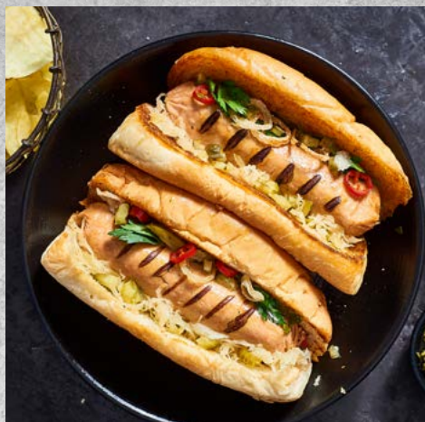
Loaded Redefine Bratwurst