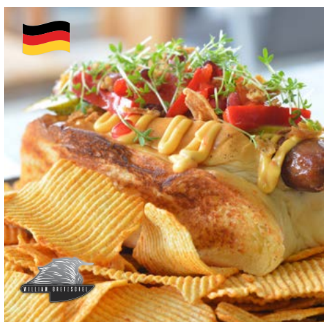
Bratwurst Chilli Cheese Dog